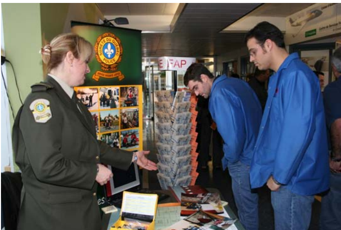
Les membres ont pu observer différentes photos prises lors d'opérations anti-drogues de la police.