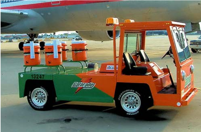
Chicago: Un véhicule est dédié à la distribution de boissons rafraîchissantes sur l'air de traficque.

hicule est d'ailleurs dédié à la distribution de boissons rafraîchissantes. Un système de climatisation est aussi mis à la disposition des employés travaillant dans les espaces cargo des avions.